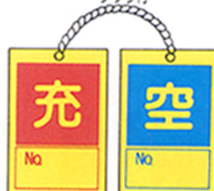
(表) (裏) M-21

■両面型ポンベ保管票 材質：硬質塩ビ板製 サイズ：90×60mm 10枚1組 クサリ付