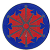
■放水口専用マーク