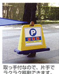
取っ手付なので、片手で ラクラク移動できます。