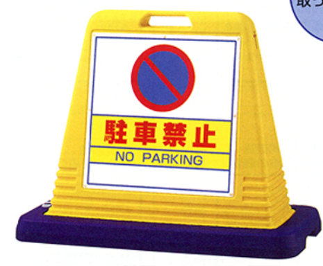
USC - 1B2 (片面) USC - 1B1 (両面)