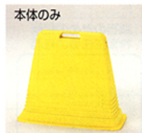
本体のみ (プラスチックビス16個付)