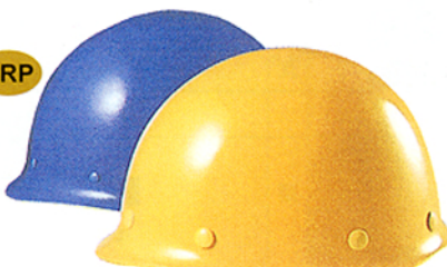
R-4 (ST-118) ★