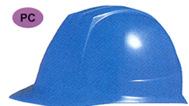
R-8 (ST-141) ★