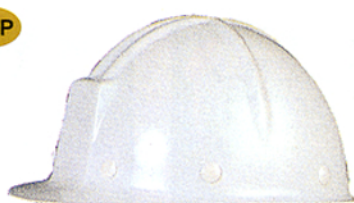
R-7 (ST-192) ★