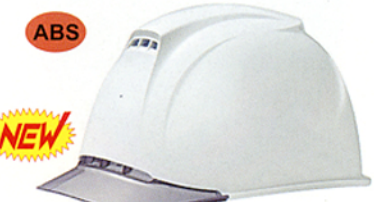
R-16 (ST-1830) ★