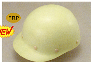
蓄光式 R-21 (ST-104・EPZ) ★