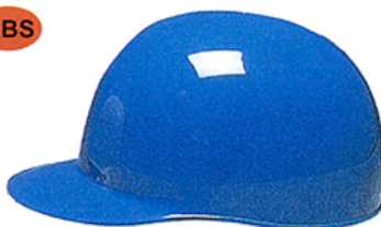
R-1 (WM-2) ★