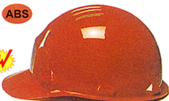
R-6 (WM-75) ★