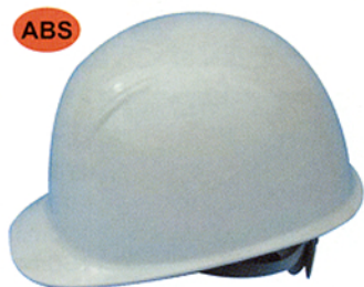
R-15 (ST-168) ★