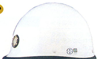
R-10 (MF2) ★