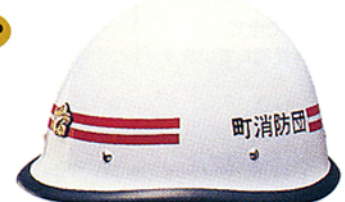
R-13 (G2) ★