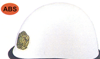
R-12 (G3) ★