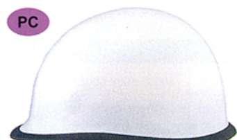
R-9 (PU-NIL) ★