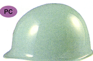
R-5 (ST-140) ★